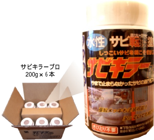
サビキラープロ 200g × 6本