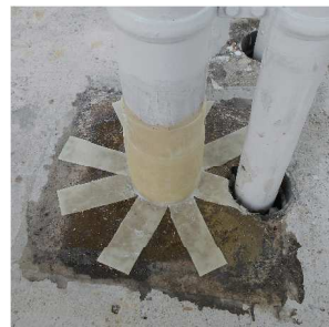
▲サビキラーPRO RSをコンクリート面 に塗布。これによりBAN-ZI AID(紫外線 硬化型補修シート)の密着を向上可能。

サビキラーPRO RSは錆転換用途だけでなく、 プライマーとしても御活用いただけます。 上塗りとしての水性・油性塗料の密着を向上さ せることは勿論、特に紫外線硬化型補修シート 「BAN-ZI AID」との相性は良く、清掃・脱脂が難 しいコンクリート面への施工時に於いて、下地 に塗布頂く事で安定した密着効果を期待する 事が出来ます。